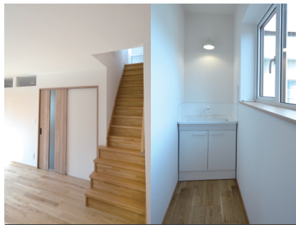
2階スペースも全てリノベーション