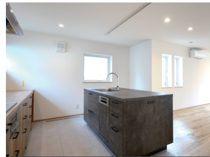
キッチンハウスのグラフィテクト