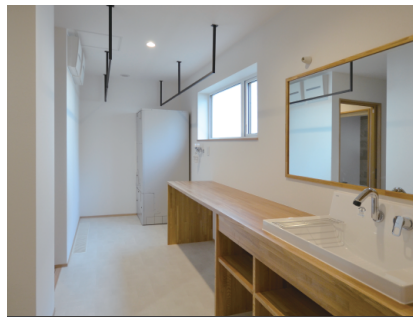
1部屋潰して広々としたサニタリーに